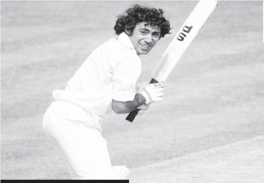
हैपी बर्थडे मुदस्सर नजर

दाएं हाथ के इस ओपनिंग बल्लेबाज ने अपने करियर में कुल 198 इंटरनेशनल मैच (76 टेस्ट और 122 व्व) मैच खेले। भले ही उनका सबसे धीमा टेस्ट शतक याद किया जाता हो लेकिन उनके नाम कुल 10 टेस्ट शतक थे। इस ऑलराउंडर खिलाड़ी ने 177 इंटरनेशनल विकेट भी अपने नाम किए।