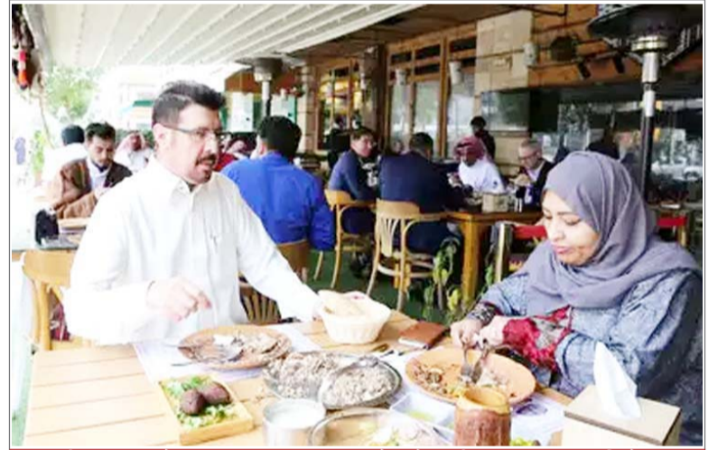
सऊदी अरब में बचा हुआ खाना फेंकने की आदत का विरोध