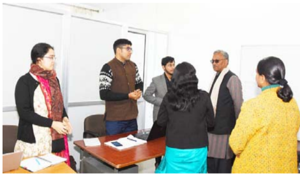
सचिवालय के चतुर्थ तल स्थित कार्यालयों का निरीक्षण करते सीएम।

संवाददाता सीएम ने सचिवालय के चतुर्थ तल स्थित कार्यालयों का निरीक्षण किया देहरादून, आजखबर। मुख्यमंत्री त्रिवेन्द्र सिंह रावत ने सोमवार को सचिवालय के चतुर्थ तल स्थित कार्यालयों का निरीक्षण किया। मुख्यमंत्री ने अधिकारियों