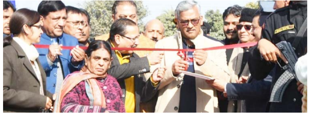
नेशनल हैण्डलूम एक्सपो का उद्घाटन करते हुए सीएम।

देशभर से आये शिल्पकारों को इससे अच्छी आमदनी भी प्राप्त होती है। अपने परम्परागत हस्तशिल्पों एवं लोक कलाओं, के संरक्षण व प्रोत्साहन हेतु सभी को आगे आने की जरूरत है। उन्होंने कहा कि नेशनल हैण्डलूम एक्सपो एक ऐसा मंच है जिसके माध्यम से राज्य के दूरस्थ क्षेत्रों के महिला स्वयं सहायता