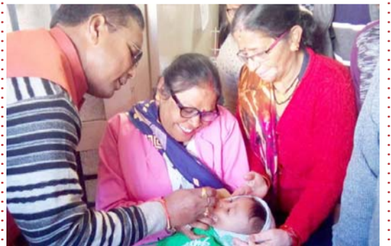
'सघन मिशन इन्द्रधनुष-2.0' के शुभारंभ अवसर पर बच्चे को ड्राप पिलाते हुए।

संवाददाता अल्मोड़ा। जिला महिला चिकित्सालय, अल्मोड़ा के परिसर में 'सघन मिशन इन्द्रधनुष-2.0' कार्यक्रम का उद्घाटन उपाध्यक्ष, विधानसभा रघुनाथ सिंह चौहान, द्वारा किया गया। इस अवसर पर विस उपाध्यक्ष द्वारा जनपद के सभी बच्चों को पूर्ण प्रतिरक्षित करने हेतु स्वा0 विभाग के कर्मियों को कहा गया ताकि सभी बच्चों स्वस्थ एवं मजबूत हो सकें और देश को आगे बढ़ाने में विभिन्न क्षेत्रों में अपना योगदान दे सकें।