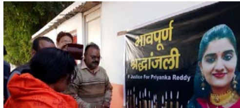
हैदराबाद की महिला डाक्टर को श्रद्धांजलि देते हुए साध्वी प्राची।

हैदराबाद में शरेआम डॉक्टर की बलात्कार के बाद कि गई नृशंस हत्या पर आज पूरे देश में उबाल है। वही दूसरी तरफ संसद में साध्वी प्रज्ञा ठाकुर द्वारा दिये बयान को लेकर हो हल्ला हो रहा है। इन तमाम बातों पर मीडिया से हरिद्वार पहुंचने पर बातचीत की विधि की फायर ब्रांड नेत्री साध्वी प्राची ने। काफी दिनों से मौन रहने के बाद आखिरकार उनका मौन टूटा तो उन्होंने हिंदुस्तान के इतिहास में हुई तमाम राजनेताओं की हत्या का जिम्मेदार कांग्रेस और जवाहर लाल नेहरू सहित