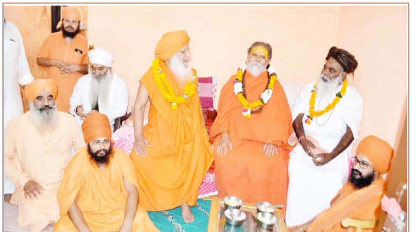
संतों से मुलाकात करते हुए महंत नरेंद्र गिरी महाराज।