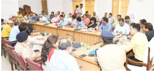
समीक्षा बैठक लेते जिलाधिकारी।

जिलाधिकारी ने 15 जुलाई से शुरू होने वाले कांवड़ मेले की व्यवस्थाओं को दुरुस्त किये जाने के मद्देनजर अधिकारियों को निर्देश दिये। साथ ही एसएसपी की उपस्थिति में पुलिस प्रशासन हेतु जरूरी आवश्यकताओं का एस्टीमेट तैयार कर उपलब्ध कराये जाने की बात कही। उन्होंने कहा कि कांवड़ पटरी के मरम्मत