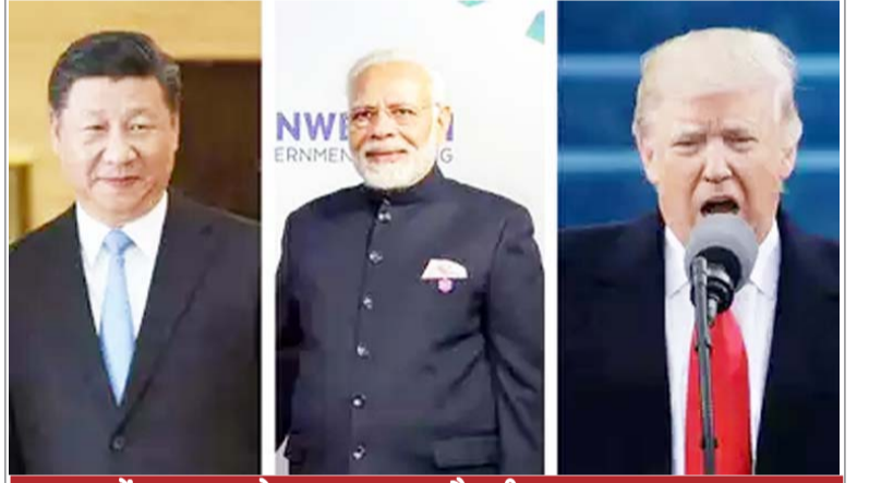
लद्दाख में भारत को उकसा रहा है चीन: यूएस

संयुक्त राष्ट्र की बच्चों के लिए काम करने वाली एजेंसी यूनीसेफ ने चिंता जताई कि कोविड-19 से दोनों देशों में चक्रवात के मानवीय परिणाम और गहरा सकते हैं।