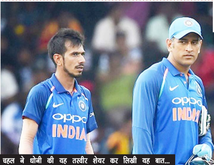
चहल ने धोनी की यह तस्वीर शेयर कर लिखी यह बात...

चहल ने अपने इंस्टाग्राम अकाउंट पर धोनी के साथ एक तस्वीर शेयर करते हुए यह भी लिखा, दिग्गज द्वारा विकेट के पीछे से तिल्ली पुकारे जाने को भी मिस कर रहा हूँ। चहल ने कहा, एक बार प्लाइंट शुरू हो जाएं और रांची पहुंच जाऊं फिर मैं उनके फैंस के लिए 24 घंटे अपना इंस्टाग्राम अकाउंट ओपन रखूंगा।