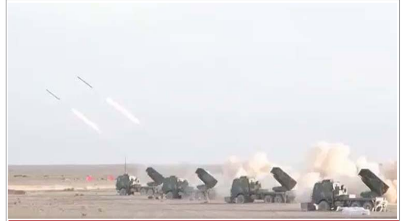
लद्दाख के पास चीनी सेना ने दागी नई मिसाइलें

कनाडा और भारत दोनों की ही सुरक्षा के लिए बड़ा खतरा बन गया है। खालिस्तानी आतंकियों ने 35 साल पहले एयर फ्लाइट में विस्फोट कर दिया था जो 9/11 के हमले से पहले हवाई यात्रा की दुनिया में सबसे बड़ा हमला था। टेरी ने कहा, यह स्पष्ट है कि पाकिस्तान लगातार खालिस्तान आंदोलन को समर्थन दे रहा है। टेरी ने कहा कि इस आंदोलन के बाद भी सच्चाई यह है कि कनाडा के सिख इस आंदोलन के जरिए अपने गृह राज्य पंजाब नहीं जा रहे हैं। उन्होंने कहा कि कनाडा के लोगों के लिए पाकिस्तान का यह कदम बड़ा राष्ट्रीय खतरा बन गया है।