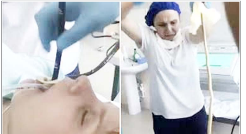
रूस की महिला के मुंह में जा बैठा एक मीटर लंबा सांप

और जापान के साथ चीन के संबंधों को लेकर सवाल के जवाब में वॉन्ग ने लद्दाख में चीनी सेना की कार्रवाई पर खुलकर बात नहीं की। हालांकि, उन्होंने कहा, भारत और चीन के संबंधों ने हाल में सभी पक्षों का ध्यान अपनी ओर खींचा है। चीन और भारत के बीच सीमा का सीमांकन नहीं हुआ है। इसलिए ऐसी परेशानी हेला रहेगी। हम भारत के साथ सभी मुद्दों को बातचीत के जरिए सुलझाने के लिए तैयार हैं। वहीं, चीन के विदेश मंत्रालय के प्रवक्ता झाओ लिजिन ने कहा कि चीन के सैनिक हमेशा से कड़ाई से वास्तविक नियंत्रण रेखा का पालन करते हैं।